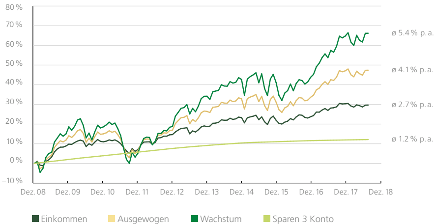
Anlagestrategien der St.Galler Kantonalbank im Vergleich zum Sparen 3 Konto Netto-Renditen nach Abzug aller Kosten

Auch wenn wir alle verschieden sind, ein Bedürfnis teilen wir alle: Wir möchten den Ruhestand in finanzieller Sicherheit geniessen können. Wege dahin gibt es verschiedene. Zusammen mit unseren Spezialisten können Sie je nach Risikoneigung Ihren ganz persönlichen Weg wählen, wie Sie in Ihre Zukunft investieren möchten.